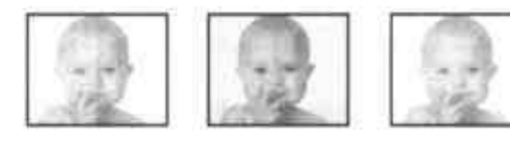
调试好个人最佳状态 一般情况下彩电所显示的状态 按下神指键之后迅速调整到您所喜欢的个人最佳状态