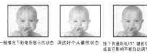
一般情况下彩电所显示的状态 调试好个人最佳状态 按下普通彩电PP键 信号变化或其他影响不能自动调节图像